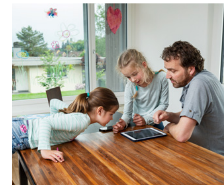
La domotica può essere controllata da remoto.