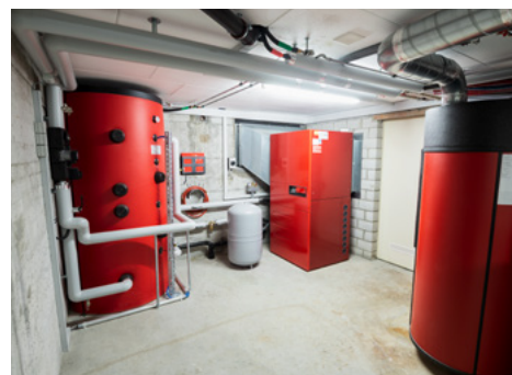
Un sistema di riscaldamento che utilizza energie rinnovabili riduce quasi a zero le emissioni di CO 2 .